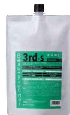
トエル ビューティーテンドー 3rd-S 1000g