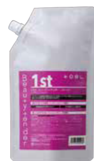
トエル ビューティーテンドー 1st 600mL