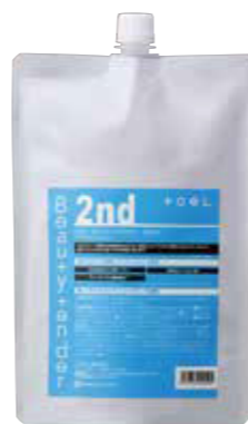
トエル ビューティーテンドー 2nd 1000g