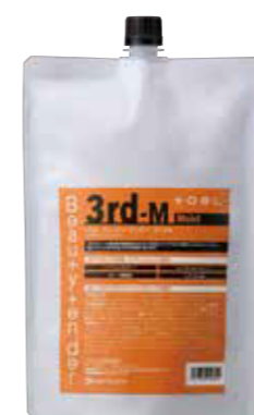
トエル ビューティーテンドー 3rd-M 1000g