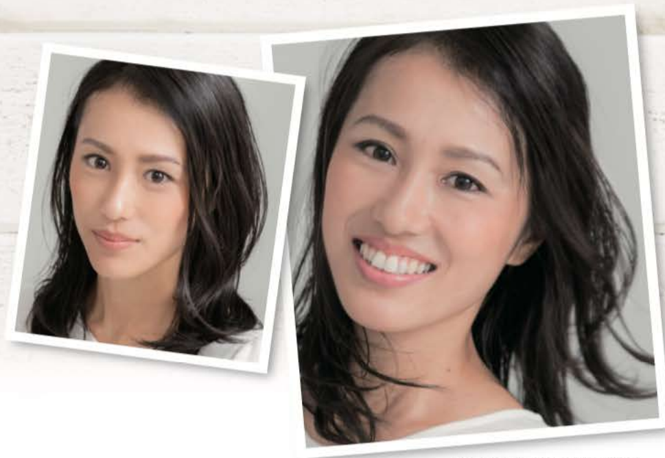
※ヘアスタイルを持続する事

メイクして髪の毛のセット、洋服や今日履いて行く靴を選んで・・・ 女性の朝はとっても忙しい！やる事が多くてあっという間に時間が過ぎて いきます。＜ボネッカ ヘアエッセンスバター＞は、「毎日キレイな私」 のために生まれました。いつものヘアケアにヘアエッセンスバターを使 えば、忙しい朝でもキレイな髪が思いのままに。おやすみ前に髪を整え て、毎朝キレイを時短でキープ！